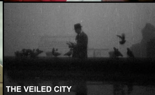
THE VEILED CITY